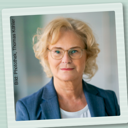
Christine Lambrecht , Bundesministerin für Familie, Senioren, Frauen und Jugend